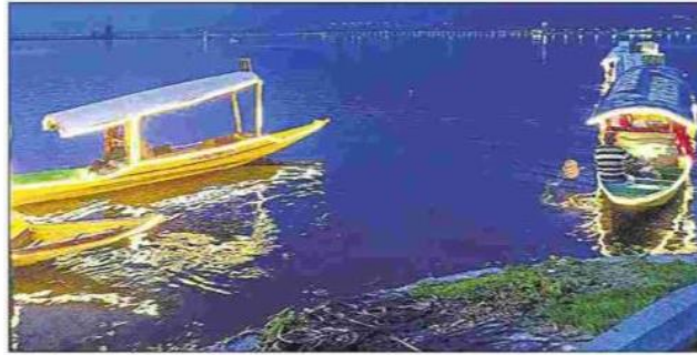
श्रीनगर की मशहूर डल झील में शाम के समय जगमग नजारा। • हिन्दुस्तान